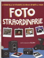
Foto straordinarie. La storia delle 30 fotografie che hanno cambiato il mondo Elleni • Becco Giallo, 2020

Rabbia, gioia, coraggio, delusione, ribellione, speranza: hai mille emozioni dentro di te, mille cose da dire, ma non sai come tirarle fuori? Il rap è quello che fa per te. Mettiti alla prova: scopri il mondo dell'hip-hop, inventa le tue rime. + 11